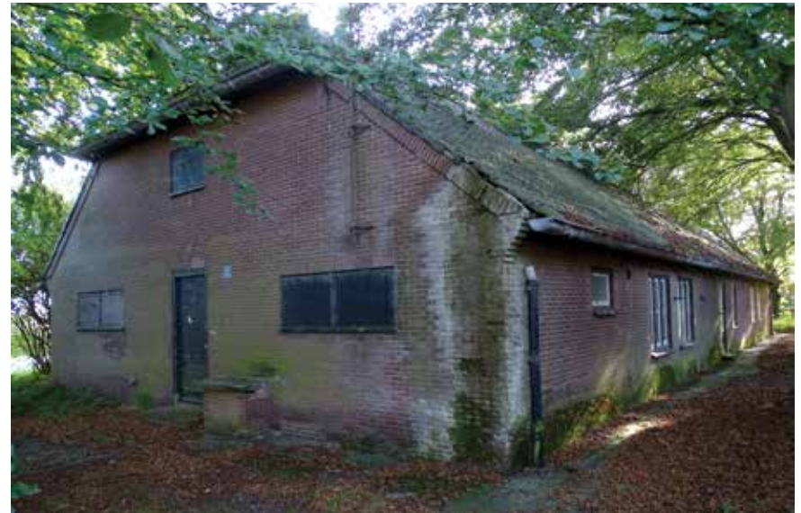
Een vervallen en overwoekerde manschappenbarak. Eerst gebruikt door de Duitse Luftwaffe, later door de Nederlandse Marine Luchtvaartdienst

architectuur van de Heimatschutzstil . De boerderijstijl was in harmonie met het landelijke karakter van het omliggende gebied en bood een goede camouflage. Door de spreiding van de gebouwen leek het vanuit de lucht op een dorpje.