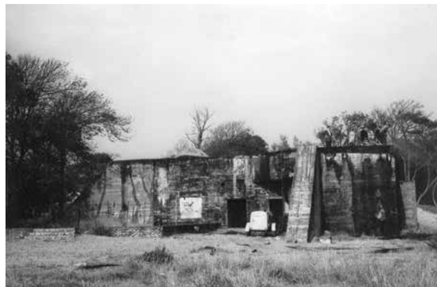
De sloop van de telefoonbunker in de jaren 60 was een enorme klus. In het dak werden gaten geboord om explosieven te plaatsen

Op het landgoed lag een belangrijk knooppunt van het Duitse Festungskabelnetz ; het militaire telefoonnet. Er werd daarom een zware betonnen bunker gebouwd waar vanuit de communicatie geregeld kon